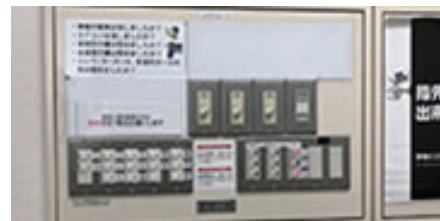
電気スイッチ (4階事務所前)