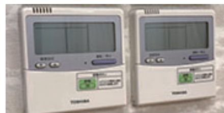
冷暖房電源 (4階ホール)